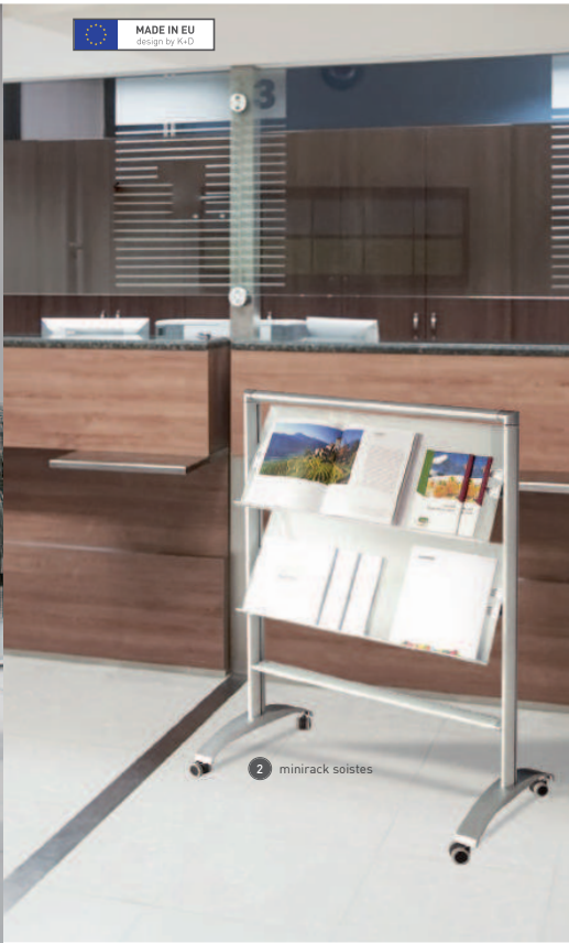
2 minirack soistes