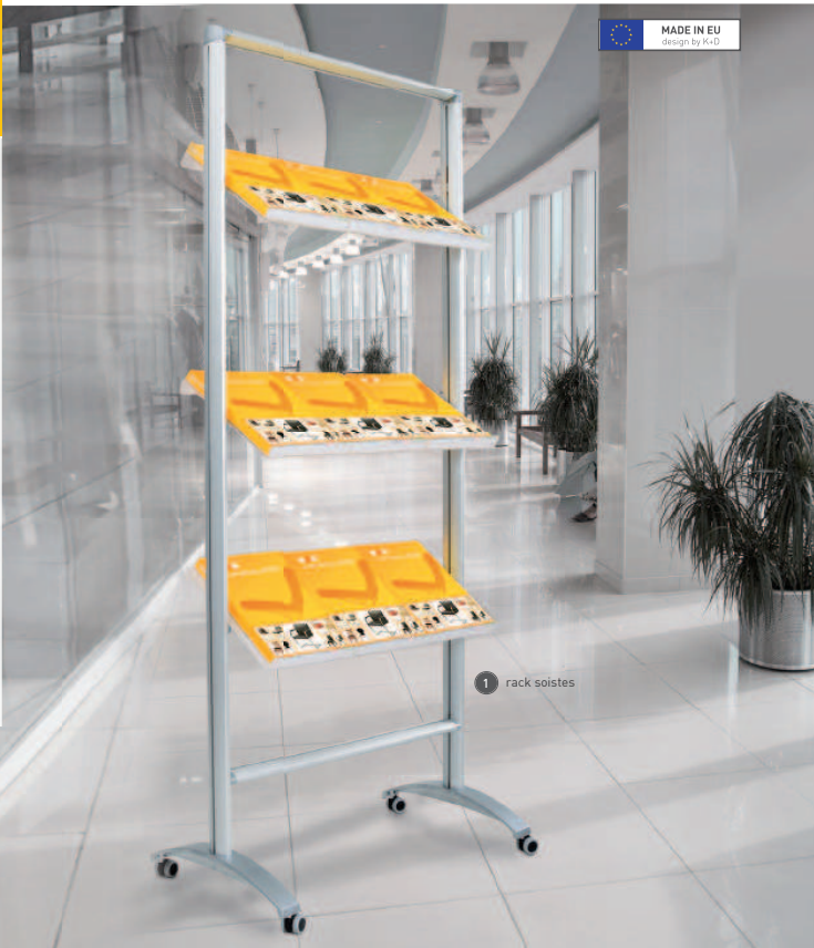
1 rack soistes